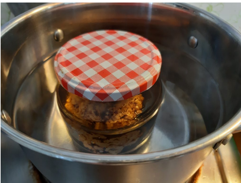
Mit Sojasoße im Glas 45 Minuten köcheln lassen