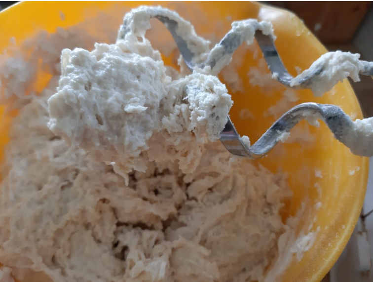
Mehl und Wasser verkneteten